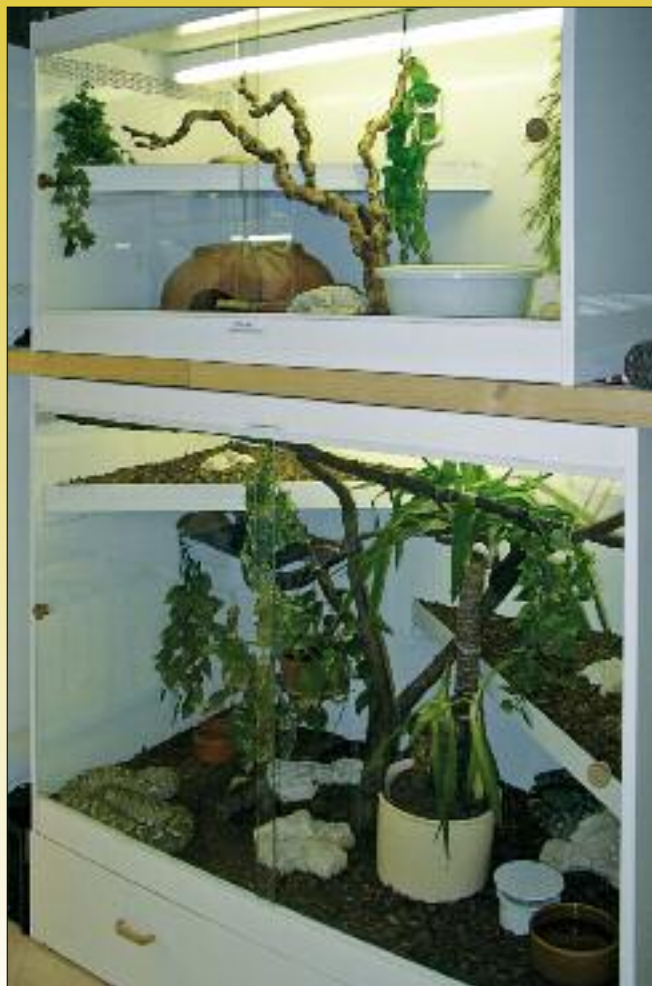
Terrarium für Madagaskar-Hundskopfoas