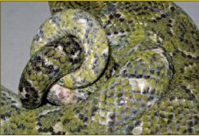
Paarung bei Sanzinia madagascariensis madagascariensis