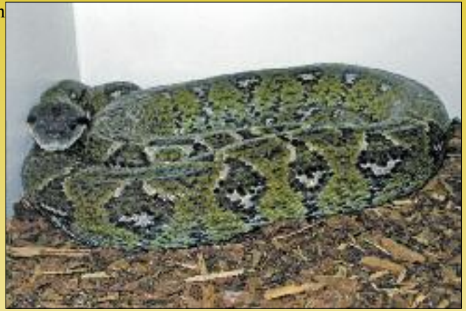
Trächtige Weibchen der Madagaskar-Hundskopfboa werden sehr dunkel und blass

Das Beutetier sollte in einer separaten Futterbox angeboten werden, damit man die Schlange besser beobachten und kontrollieren kann. Auch das Handling mit der Schlange wird durch diese Art der Fütterung wieder ein wenig aufgefrischt, sodass die Boas den direkten Umgang gewöhnt und damit zutraulicher bleiben.