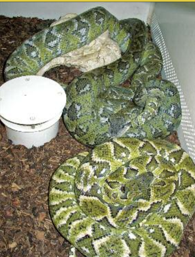
Paarungsaktivitäten bei Sanzinia madagascariensis madagascariensis